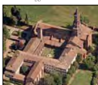
L'Abbazia di Clairvaux (Clara Vallis) fondata nel 1115 da Bernardo è situata nell'odierna Ville-sous-la-Ferté, nel dipartimento dell'Aube, regione Champagne-Ardenne, in Francia. Esistono altre abbazie con lo stesso nome: Abbazia di Chiaravalle della Colomba presso Alseno (Piacenza); Abbazia Santa Maria di Chiaravalle di Fiastra presso Tolentino (Macerata); Abbazia Santa Maria in Castagnola presso Chiaravalle (Ancona).

La Glorificazione della Vergine, in mandorla e in trono accanto al figlio attorniato da angeli e santi, la Deposizione ripresa dall'iconografia giottesca e il Corteo Funebre che passa sopra l'arco sono le scene di maggior efficacia.