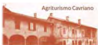
via Cavriana 51, Milano

Le opere rimarranno esposte fino al 25 aprile in contemporanea con