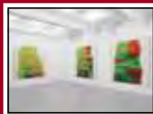
Mario Nigro mostra personale 18 marzo/6 maggio 2010 A Arte Studio Invernizzi Milano