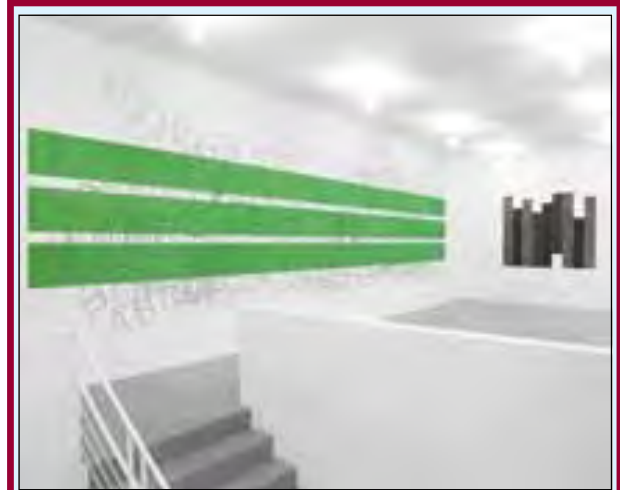
"Drawn, rubbed, smeared 9 works applied directly to the gallery walls"

Alla galleria A arte Studio Invernizzi di Milano prosegue la mostra personale dell'artista inglese David Tremlett, che presenta in questa occasione nove 'Wall Drawings' appositamente creati per gli spazi della galleria.